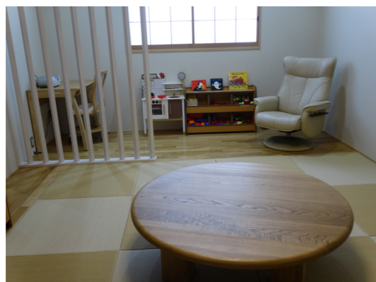
蔵本地区 女性職員休憩室Rococo

これまでの取組を基盤として、2018(平成30)年に科学技術人材育成費補助事業「ダイバーシティ研究環境実現イニシアティブ(牽引型)(2018(平成30)年～2023(令和5)年)」に「四国発信!ダイバーシティ研究環境調和推進プロジェクト」が採択され、代表機関として研究環境におけるダイバーシティ推進に向けて8機関と連携し地域を牽引する取組を行っている。