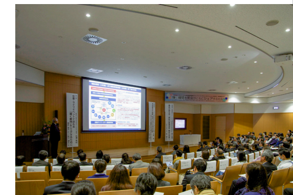
ダイバーシティ推進シンポジウム