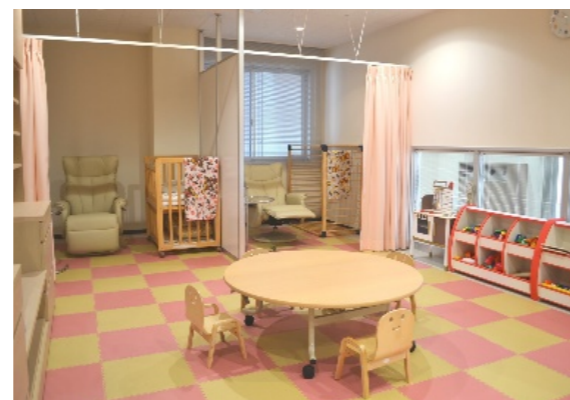
常三島地区 あわさぼキッズルーム