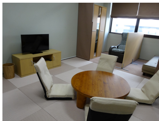
常三島地区 女性職員休憩室RococoII